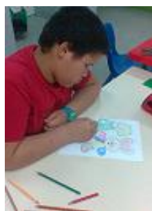
Coelhinho da Páscoa