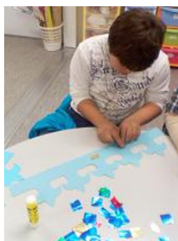
Coroa do Dia de Reis

No âmbito da expressão plástica, fizemos a coroa do Dia de Reis, máscaras de Carnaval, desenhos da Primavera, a prenda para o Dia do Pai e um coelho de Páscoa.