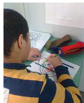
Máscara de Carnaval