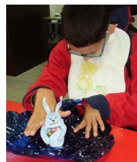
Prenda da Páscoa

Ao nível da Língua Portuguesa funcional, realizaram-se diversas fichas de trabalho, grafismos, leitura e exploração de histórias (em SPC e no computador).