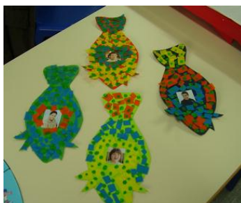
Prenda do Dia do Pai