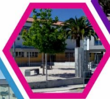
Escola Básica do Tramagal