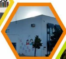
Escola Básica da Chainça