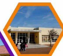
Escola Básica António Torrado