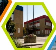
Escola Básica e Secundária Octávio Duarte Ferreira