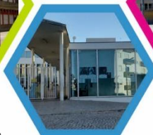
Escola Básica e Secundária Dr. Manuel Fernandes