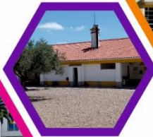
Escola Básica de S. Miguel do Rio Torto