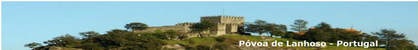
Póvoa de Lanhoso - Portugal