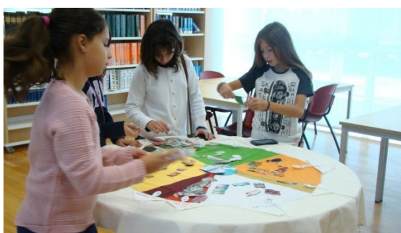
Atividades da Roda dos Alimentos