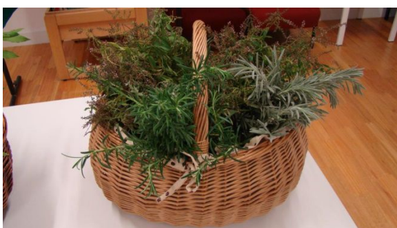
Cesto com ervas aromáticas

Assinalou-se no passado dia 16 de outubro o Dia Mundial da Alimentação com um conjunto de atividades que decorreram nas bibliotecas das escolas Dr. Manuel Fernandes e Octávio Duarte Ferreira. Os alunos foram convidados a participar na elaboração de uma Roda de Alimentos, na identificação de ervas aromáticas pelo cheiro e na medição da pressão arterial. Estudantes e restante comunidade educativa foram igualmente sensibilizados para os benefícios do consumo de fruta fresca, disponibilizando-se para o efeito, no corredor junto ao refeitório e ao bufete, um cesto com laranjas, bananas, peras, maçãs e uvas, juntando-se folhetos informativos no placard existente acerca das vantagens do consumo destes alimentos.