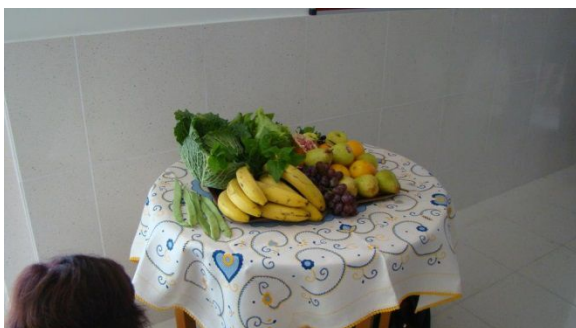
Fruta fresca oferecida